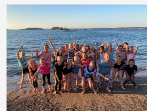
Foton tagna av lagens ledare.