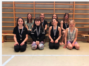
Lagfoton tagna av lagets ledare.